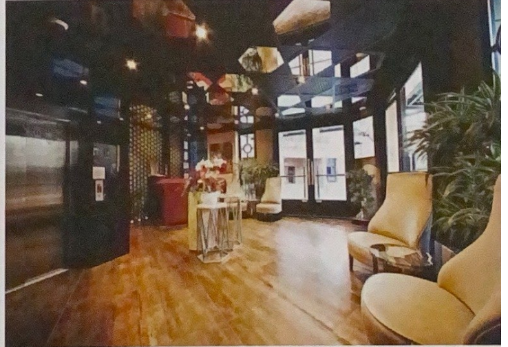
The Haze Hotel