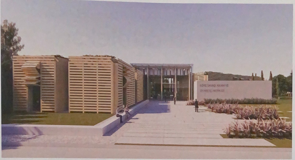
Kore Savaşı Anıta ve Ziyaretçi Merkezi

Sizlerin gerçekleştirdiği tasarımların temelinde neler var?