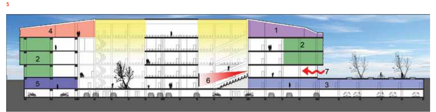
1. Konferans salonu Conference hall 2. Sınıflar Classrooms 3. Laboratuvarlar Laboratories 4. Yemekhane Dining hall 5. Bowling & Buz Pisti Bowling & Ice Skating 6. Açık Sinema & Gösteri Alanı Open Theatre & Event Space 7. Öğrenci Girişi Student Entrance

Mağazalardan sınıfa dönüştürüldüğü için küçülen birimler mevcut sirkülasyon alanının genişlemesine neden oldu.